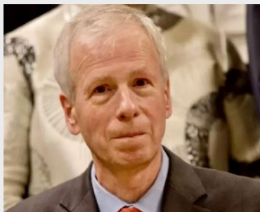
Stéphane Dion

C'est avec plaisir que Perche-Canada salue la nomination de Stéphane Dion, comme ambassadeur du Canada à Paris.