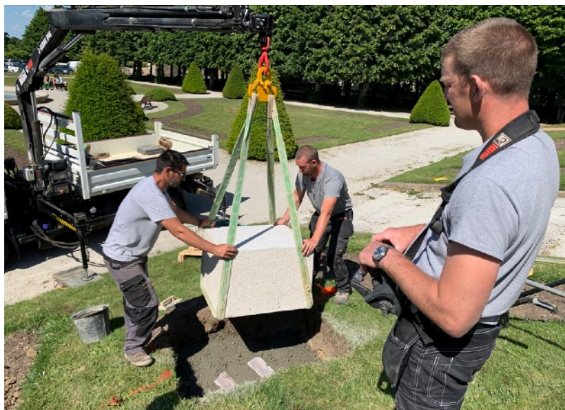
Mardi 31 mai : les Ets Mousset, de Saint-Germain-de-Martigny, ont procédé à la pose du socle de la statue dans les jardins de l'hôtel de ville.

Après la réunion technique organisée le 12 avril aux Ets Macheret à Monfort-le-Gesnois, le projet de statue de Pierre Boucher est passé dans sa phase active avec la pose du socle. Trois semaines de séchage étant nécessaires, la statue sera posée fin juin.